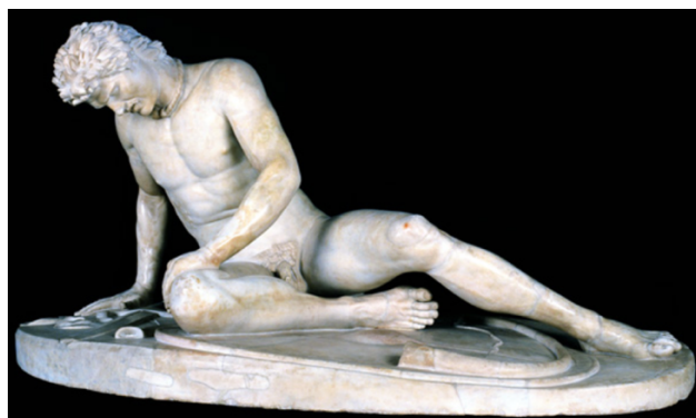
'De Stervende Galatiër / Galliër' (circa 60–40 voor Chr.)

© Capitijnse Musea, Rome (inventarisatie nr. S747)